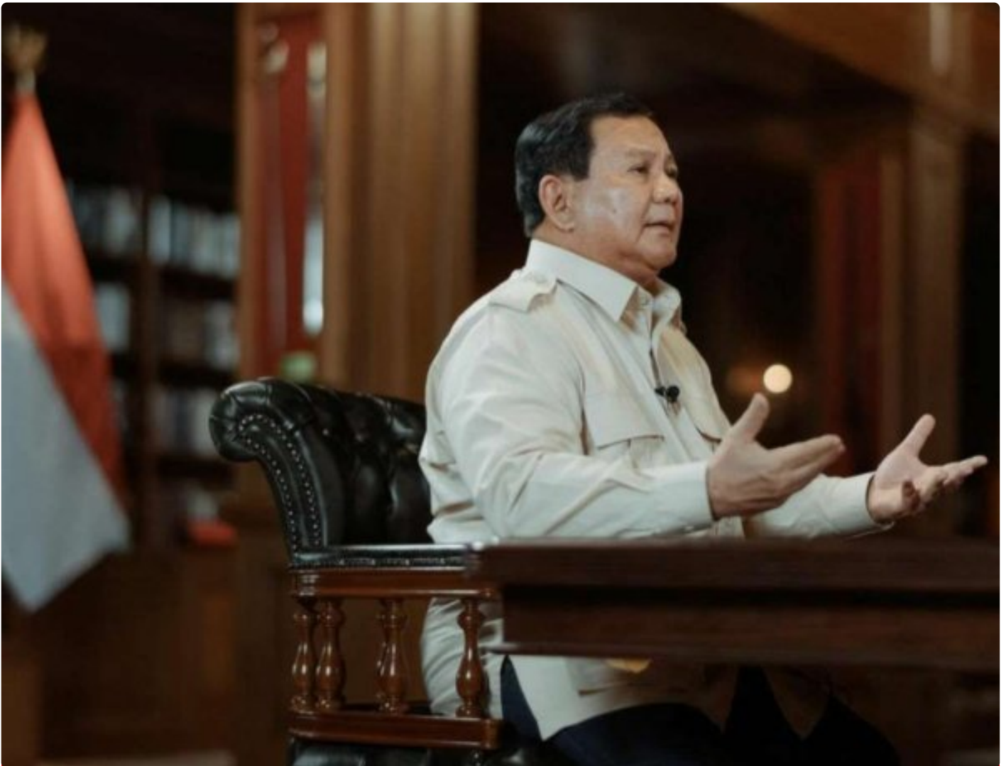
Prabowo Subianto Presiden RI 2024-2029

PENDIDIKAN - Indonesia dikenal sebagai negara yang kaya akan sumber daya alam. Dari hasil tambang yang berlimpah, laut yang luas dengan kekayaan hayati yang melimpah, hutan yang menjadi paru-paru dunia, hingga sumber daya energi yang tersebar di berbagai wilayah, semuanya menjadi kekuatan besar bagi bangsa ini. Potensi besar tersebut seharusnya dapat dimanfaatkan untuk